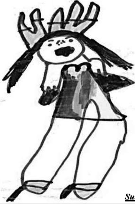
Sude Naz ÖNAL