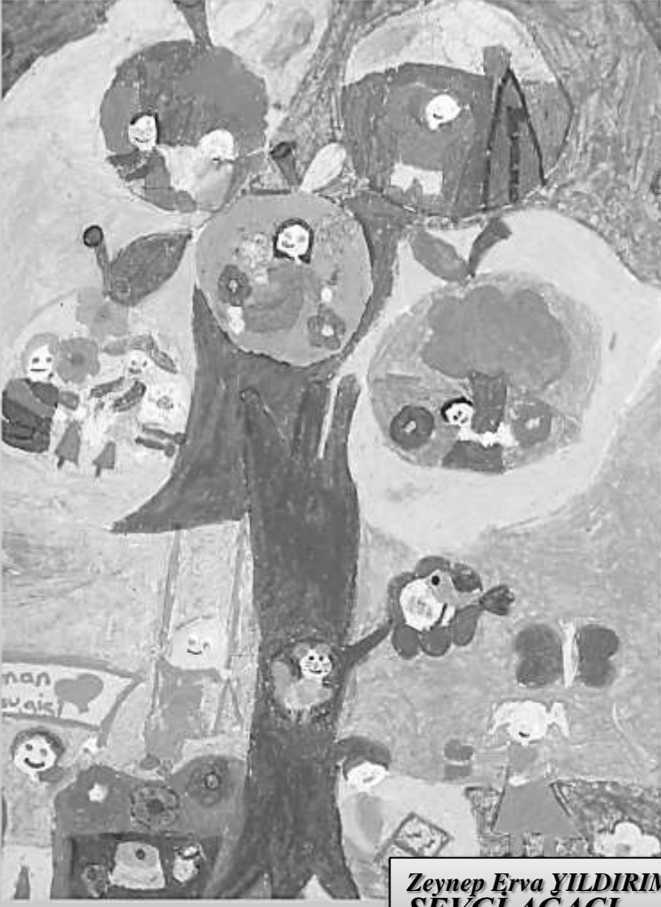
Zeynep Erva YILDIRIM SEVGİ AGACI