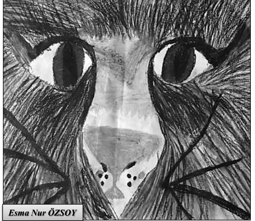
Esmâ Nur ÖZSOY

Burası havuz başında ağaçların arasında çok güzel bir yerdi. Herkes çocuğuyla gelmişti.