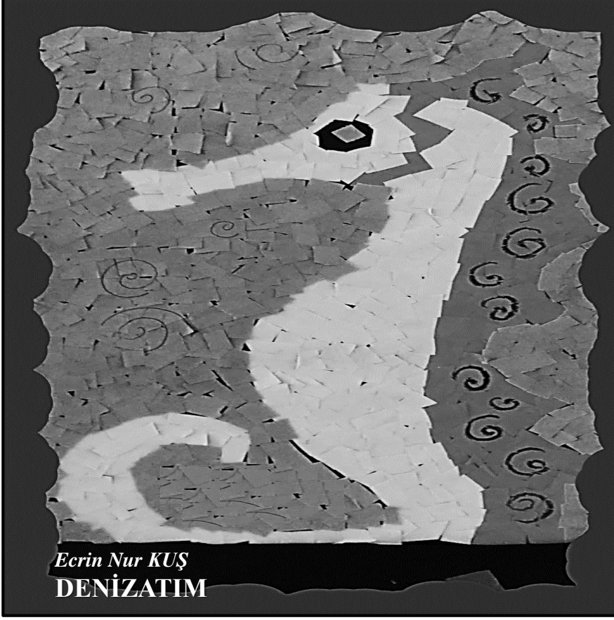
Ecrin Nur KUŞ DENİZATIM