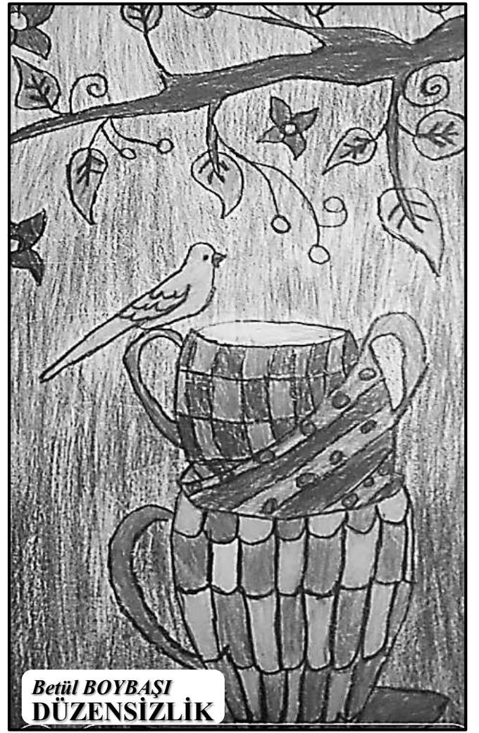
Betül BOYBAŞI DÜZENSİZLİK

En önemlisi de asla doktor ve hemşirelerden korkmayacaklar, onları çok seveceklerdi.