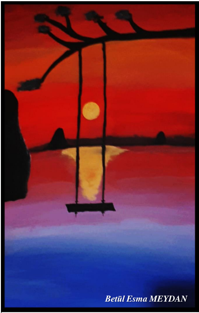
Betül Esmâ MEYDAN